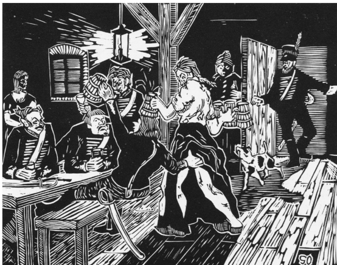
Efter oroligheterna utplacerades militär i gårdarna för att tillse att inga oroshärddar blossade upp på nytt. Det minsta man kan säga om dessa militärer var att de uppförde sig ordentligt.

På åställda frågor swarar han, att han ei känner någon anförare, hälst de, som efter dess förmenande hade sådan befattning, woro