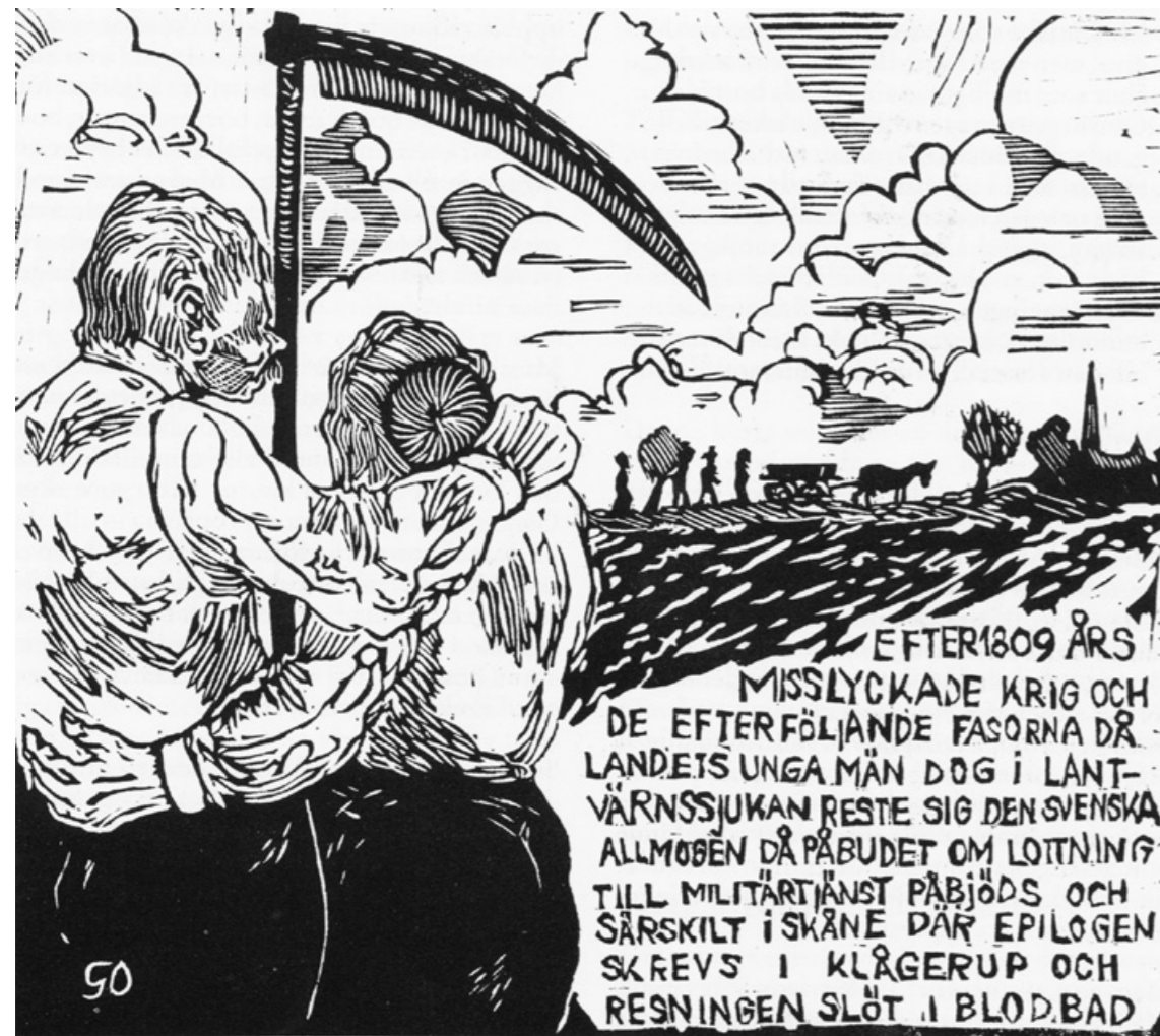
Det gamla paret betraktade tyst begravningsståget. De såg det som ett dåligt omen och mindes hur de själva och trakten hade förlorat många raska unga män vid förra utskrivningen till krigstjänst. Nu ryktades det att det var tid igen ...

Skåne var i början av 1800-talet en rik landsdel i det svenska kungariket. Naturresurserna var emellertid mycket dåligt utnyttjade. Jordbruket var på sina håll i direkt bedrövligt