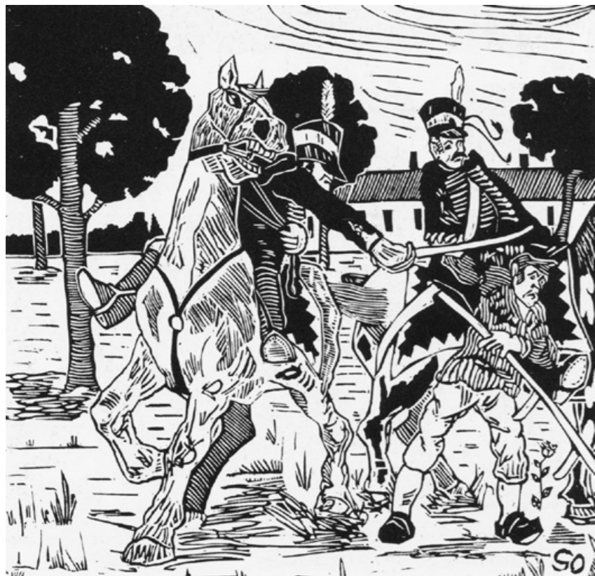
Någon såg sin far skjutas ihjäl. Sabelhugg hade haglat, bajonetter färgats av blod, kulor hade vinit. Svenskt blod hade runnit för svenska vapen på svensk jord.