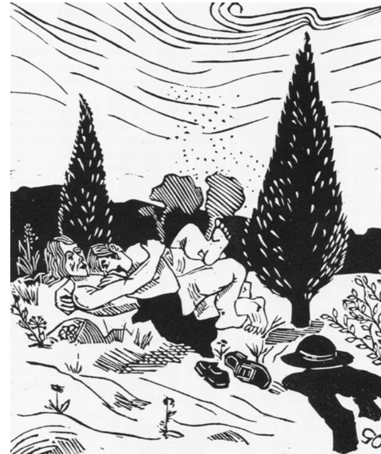
Många olyckliga pigor skapades dessa febriga nätter, många barnföddes nog som "oäktingar" som resultat efter oroligheterna i landet.