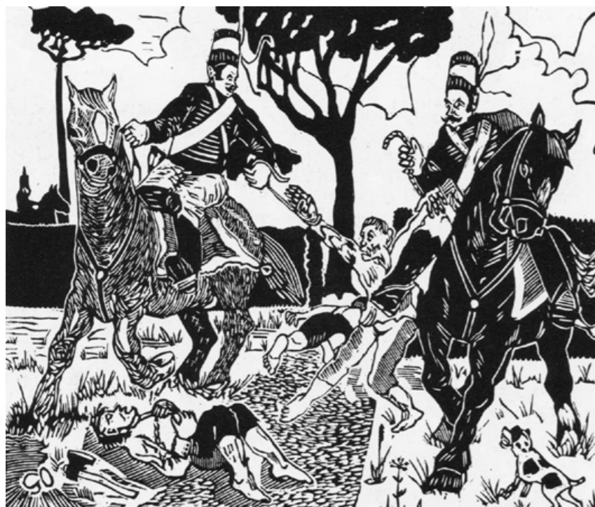
Omsider upphörde slaktningen och man infångade de av de olyckliga som överlevt och som ej lyckats fly.