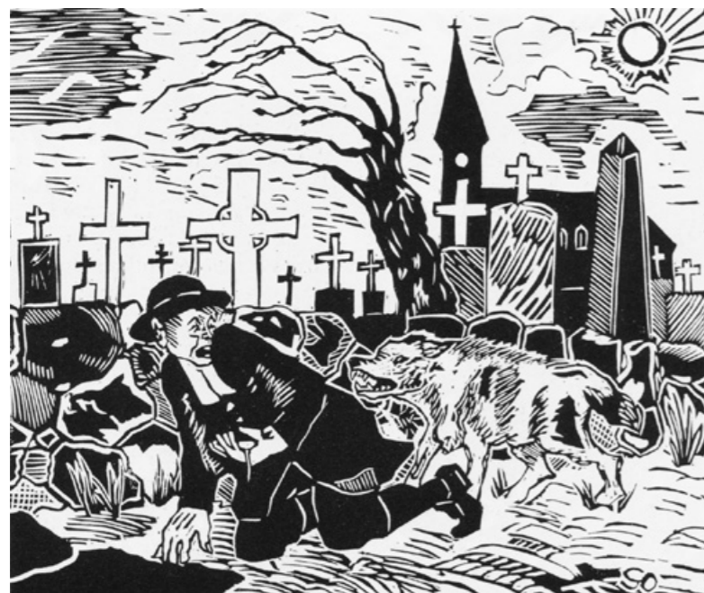
De döda under upproret och de avrättade fick ej begravas i vigd jord. Detta faktum bör ha gett åtminstone några präster samvetsbetänkligheter; dom bör ha känt djävulens käftar och dåliga andedräkt bakom sig när de förvägrade någon en kristen begravning.