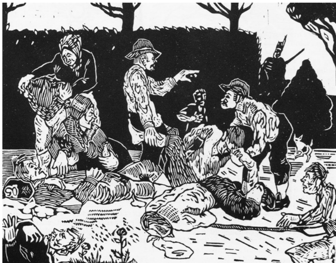
Man var mycket villrådig hur man skulle förfara med de avlidna. Länsstyrelsen beslutade att liken kunde nedgrävas avsides. En del av den mödan besparades kronobetjäningen då många lik redan blivit borttagna.