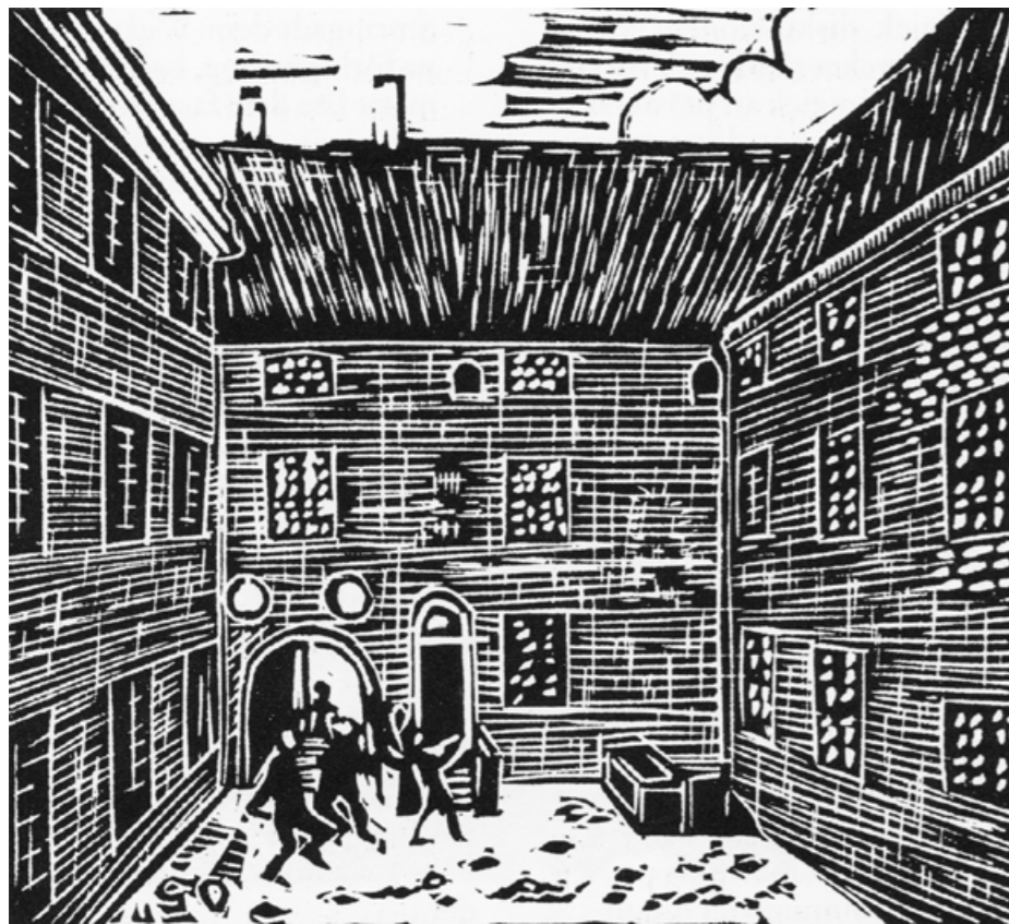
Bondhopen tog sig in på Svaneholms kringbyggda borggård. Var fanns borgherren?