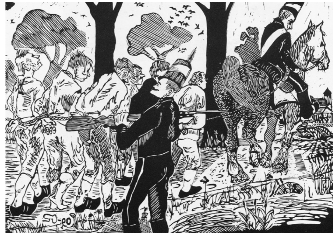
Intåget i staden var hemskt. Fångarna var utmattade och utmärglade efter flera dagars kringstrykande utan annan egentlig förtäring än brännvin. De var bundna tre och tre illsammans med händerna på ryggen och släpades efter hästar.