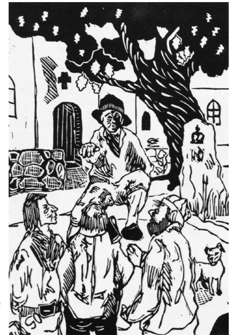
Trots förbud att använda byahornen för att sammankalla folk, ljöd sådana flitigt dessa dagar och man träffades för att diskutera vad som var att göra för att stoppa lottningen.