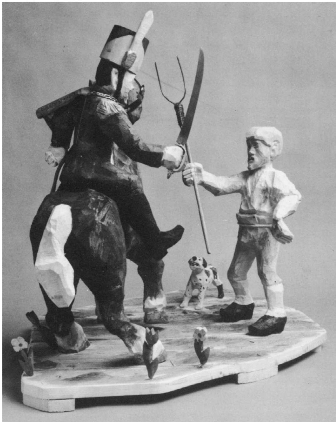
Mot militärens vapen hade de onyktra och i stort sett helt obehäpnade drängarna intet att sätta mot.

hvarföre jag så snart folk och hästar fått något lite hvila fortsatte tåget emot sistnämde ställe.”