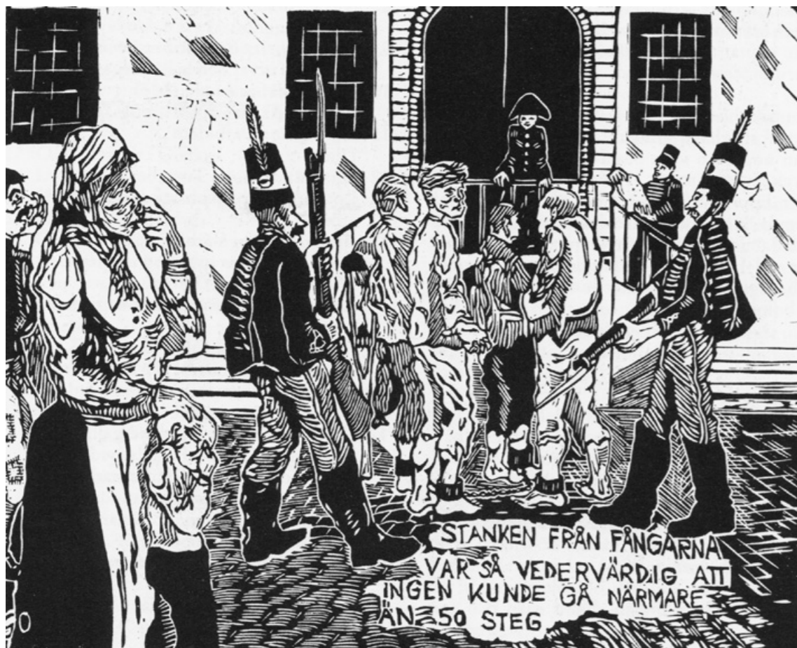
Lukten var föga angenäm när fångarna den 4 november 1811 fördes ut på Malmö Stortorg för att offentligt få höra sina domar.

”I dag har Kgl. Hofrättens domar öfver större delen af de här för uppror häktade blifvit dem högtidligen kungjorde. Ceremonien vid detta tillfälle var ganska imponerande. Med en stark escorte blefvo fångarne från citadellet afhemtade, och vid ankomsten till torget insläpptes de i en af garnisonen formerad fyrkant.