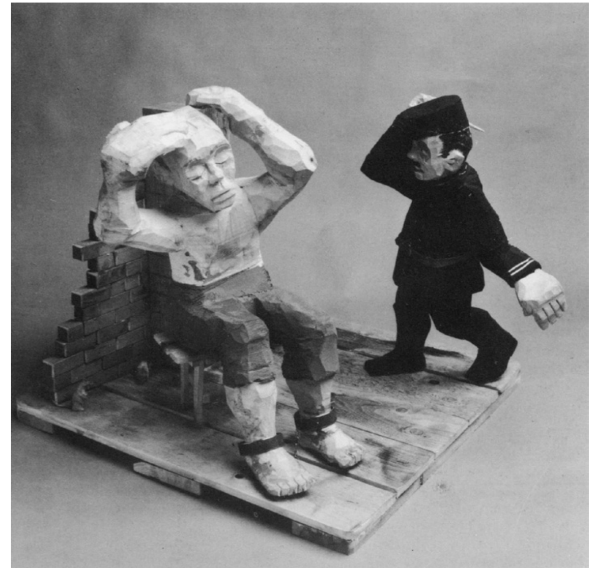
De vidriga förhållandena för fångarna trotsar all beskrivning. Många erhöll spöstraff.