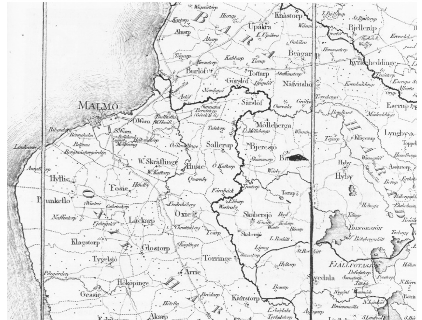
Området öster om Malmö, ett av upprorsbygderna sommaren 1811.

Men torget utanför är förvisso inte tomt. Många blickar kastas denna kväll upp mot de ljusa fönstren. Ett människosorl från hundratals strupar börjar växa sig starkt. När kyrkklockan uppe i skyn slår sju slag brister alla fördämningar. Några förvetna ledare stormar upp för rådhusets höga trappa, knuffar omkull de förskräckta vakterna och rusar in i överhöghetens stoltaste boning. Snart är rådhusets förstuga fylld av bondrängar, borgardrängar, bodknoddar och annat fattigt folk. Man bryter ner väggen in till arrestlokalen. Med triumferande tjut fritas en i häktet insatt dräng. Pöbeln avtågar till stadens stora brygga med drängen buren på starka axlar. En väntande båt för ynglingen över sundet.