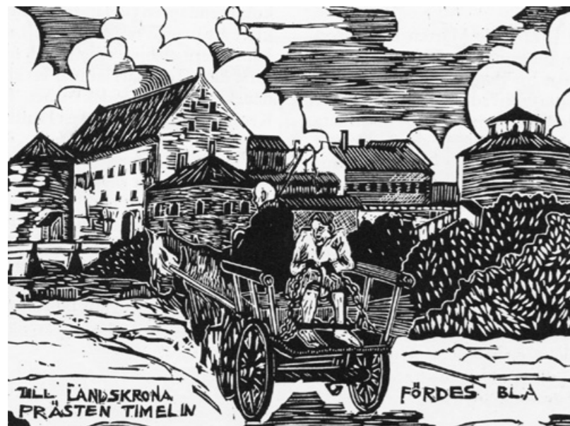
Fångar fördes till olika fästningar runt om i landet för att avtjäna långa fängelsestraff.